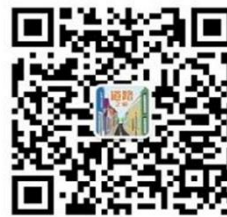
微信公众号 道路之家